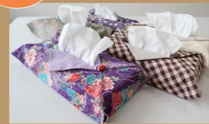
ティッシュカバー