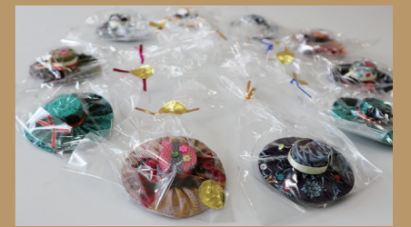
帽子のマグネット