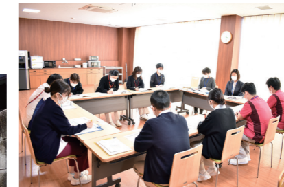
県立広島大学による説明会

県立広島大学研究チーム主導での早期自宅退院支援プログラム「おかせりプロジェクト」に参加させていただくことになりました。認知症治療病棟の入院長期化は社会的な問題であり、自宅への退院支援には、方向性のミスマッチ、家族背景の制約、組織的背景の規制などの多様な課題や困難があります。おかせりプロジェクトは、対象者のADL維持、BPSD改善、家族介護者の介護負担感の軽減、介護肯定感の向上、在院日数の減少など、一定の影響を与える可能性があります。大学の先生方に来院していただき、プログラムの具体的な内容と実施についての説明を受けて、実際にスタートさせました。対象者を選定し、ご家族への同意を得ましたので、患者さまが安心して退院することができるように多職種で取り組んでいきたいと思っております。