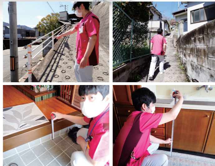
家屋および自宅周辺的环境調査